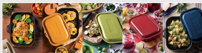
ブラック イエロー グリーン レッド ブルー