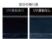
翌日の残り湯 UV運転あり UV運転なし

残り湯の菌が軽減される事で部屋干しなどによる洗濯物の気になるニオイの発生を抑制。